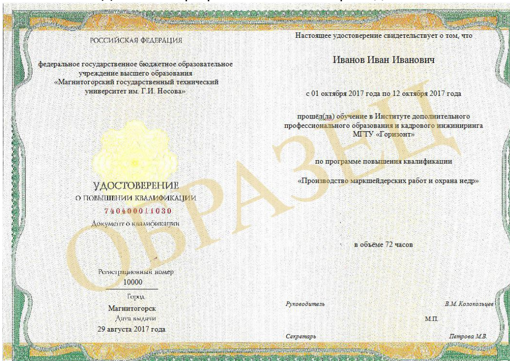
Удостоверение о повышении квалификации

ИДПО «Горизонт» 455026, Россия, Челябинская область, г. Магнитогорск ул. Дружбы 22/1, тел. (3519) 265-263, 265-110, 265-264, 421-315 сайт: idpo.magtu.ru, e-mail: idpo@magtu.ru