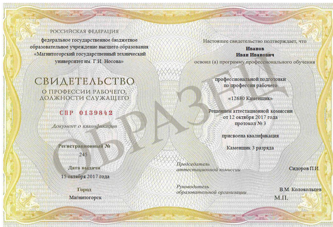
Свидетельство о профессии рабочего, должности служащего