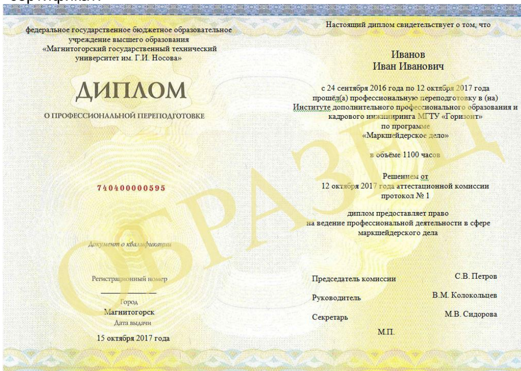
Диплом о профессиональной переподготовке